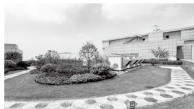
图2 屋顶花园排烟风机布置

屋顶风机风管原采用铁皮制作，考虑到室外容易锈蚀，特别是铁皮的切口部位长期暴露在空气中，经历风吹日晒，锈蚀比较多，防虫铁丝网也会出现类似情况。帆布软接如果时间长，也会出现破损，防排烟阀门部位也易锈蚀，操作不便。因此，屋顶风管均采用不锈钢风管，帆布软接采用不锈钢软接，阀门定制不锈钢阀门。整体效果美观，经久耐用（见图2）。