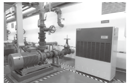
图3 设备机房设置除湿机

南方地区在梅雨季节,地下室空气湿度较高,地下室铝皮保温易结露和氧化,土建墙面易发霉,各种金属构件、螺丝螺帽易生锈,本项目物业管理部在梅雨季节开启地下室的通风管道进行排风,同时在设备机房安装工业除湿机(见图3)除湿,相对湿度能够达到45%~65%。