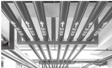
图1 成排喷淋管道油漆色标

(2) 电气工程，重点做出如下整改措施：桥架吊筋的相应处理，过长的通丝进行割除并增加不锈钢装饰帽，同时通丝上套PVC套管。根据桥架所属系统不同，在桥架上进行标识喷绘，区分强弱电系统，并体现公司Logo。